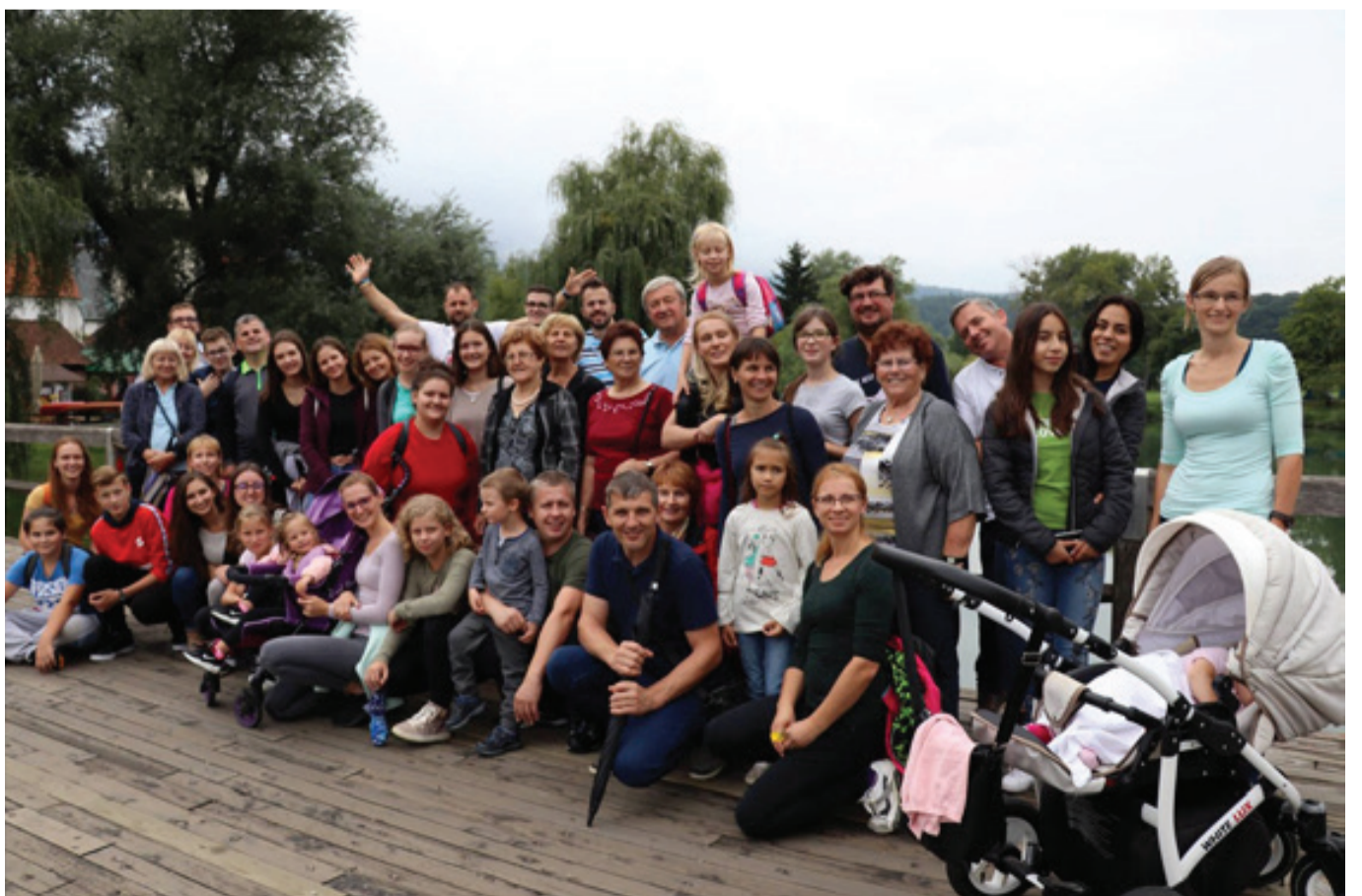
Člani društva so se na letošnji zaslužen izlet odpravili v Posavje.

Tudi najmlajši Zvončki so ob nedeljah pred mašo spet zbrani na pevskih vajah. Cerkveno revijo mladinskih zborov so v juniju več kot uspešno zastopali, nato pa se podali na počitnice do avgusta, ko jih je čakal mladinski glasbeni tabor, letos jubilejne narave. V omenjenem projektu so sodelovale vse sekcije društva, saj je terjal kar nekaj organizacije in koordinacije. Ne smemo pozabiti tudi na Cerkveni pevski zbor Jutranja zarja, ki je reden pri nedeljskih ranih